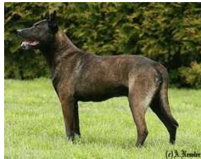
BRN 10275 | Layka (Mevr. S. Duda, Ebelsbach, BRD)

VPG III (95-90-97), IPO III (96-96-98), FPr III (85), FH II (88), WH, StPr I (100) HD/ED frei Geb.datum: 02-06-2001