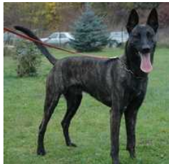
BRN 14917 | Rommel (Mevr. C. Simmat, Salzhemmendorf, BRD)

Diensthond Polizei Niedersachsen HD/ED frei Rücken ohne Befund Geb.datum: 12-07-2007