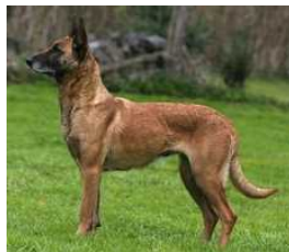
BRN 11966 | Rommel's Lotte (Dhr. H. Niemann, Magdeburg, BRD)

VPG III (95-90-97), IPO III (96-96-98), FPr III (85), FH II (88), WH, StPr I (100) HD/ED frei Geb.datum: 02-06-2001