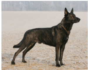
BRN 15800 | Rommel's Gonzo (Mevr.. A. Nessler, Bochum, BRD)

IPO III, FH II, AD. HD-B1, ED-0, Ruecken o.B. Geb.datum: 08-03-2009