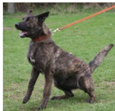
BRN 11336 | Rommel's Krümel (Mevr. A. Winters, Bluffdale Utha, USA)

VPG III (95-90-97), IPO III (96-96-98), FPr III (85), FH II (88), WH, StPr I (100) HD/ED frei Geb.datum: 02-06-2001