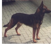
BRN 2354 | Meta (Dhr. Nieling, Schinveld)

Geb.datum: 21-12-1991 / † 18-02-2005 5 nakomelingen op het NK