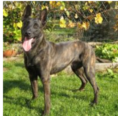
BRN 13204 | Rommel's Danger (Dhr. D. Lintner, Jenbach, Osterreich)

BH, HD B1, ED-0, Ruecken o.B. Geb.datum: 25-08-2010