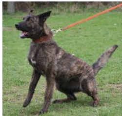
BRN 11336 | Rommel's Krümel (Mevr. A. Winters, Bluffdale Utha, USA)

AD; VPG A (90/96) HD A1/ED 0 Geb.datum: 14-02-2005 Voorheen: Dhr. M. Rommel, Hettstedt, BRD