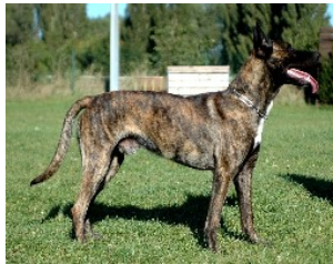
BRN 13105 | Falco (Dhr. H. Burger, Pfaffstätten, Osterreich)

Sch.Hund II Geb.datum: 12-07-2007 Chipnr: 276098100784495