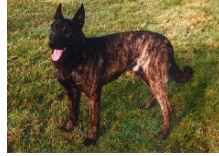
BRN 5298 | Kelly (Dhr. S. Meijer)