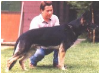
Mink vom Haus Wittfeld (Dhr. E. Roddewig, BRD, SZ 1569341)

Sch.Hund III, FH, AD. HD A Geb.datum: 03-11-1982 AKC D217151