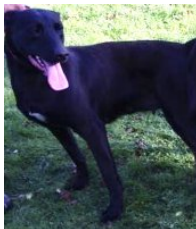
BRN 21329 | Mem (Dhr. E.H.J.N. Verhoeven, Beek en Donk)

PH I 400 CL (2014) Obj. 380 CL (2014) KNPV toetsing Geb.datum: 08-07-2006 († 26-03-2019)