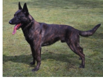
BRN 18726 | Jamie (Dhr. P.C. Kepers, Oisterwijk)

Geb.datum: 13-03-2010 3e Nationale lichtwedstrijd te Best 2012 (416